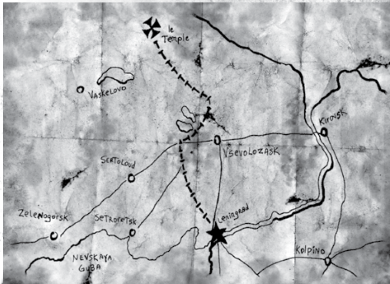
Léningrad - Document F