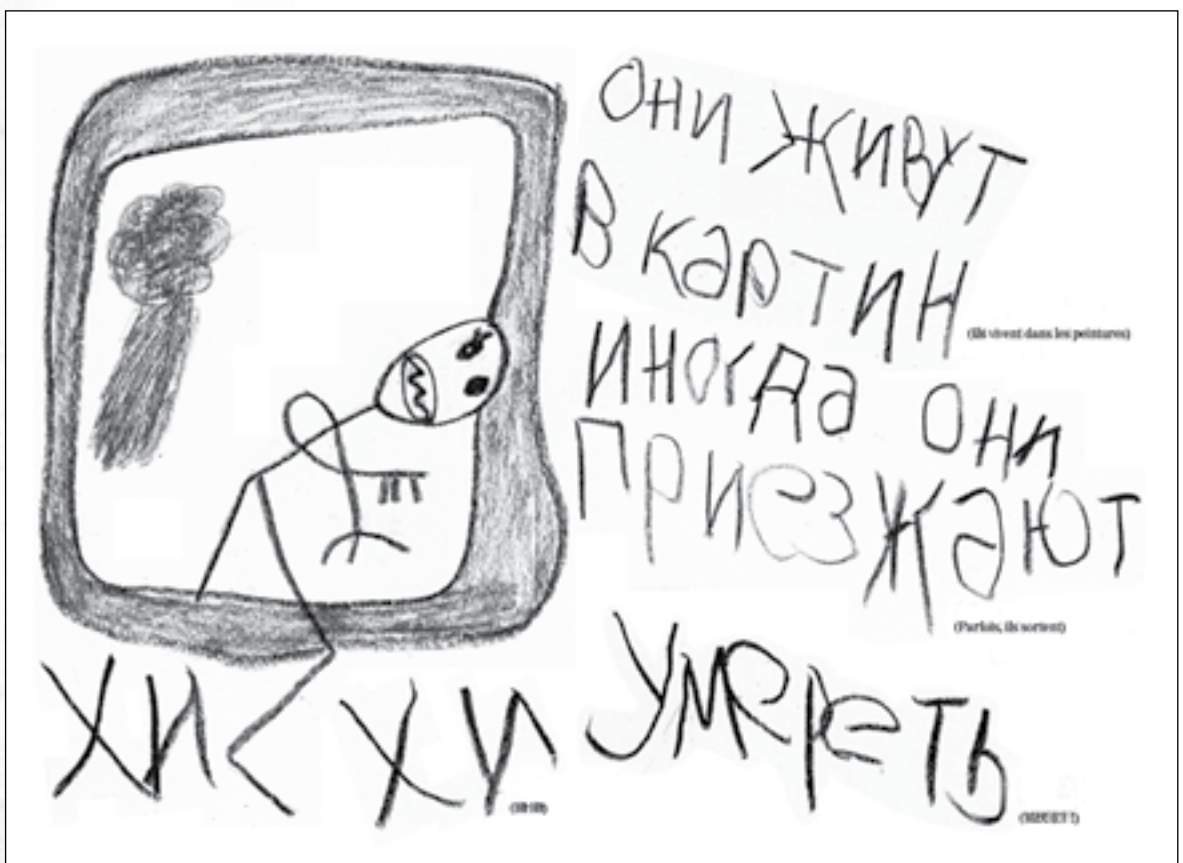
Leningrad - Document D

Они живут в картин иногда они приезжают умреть