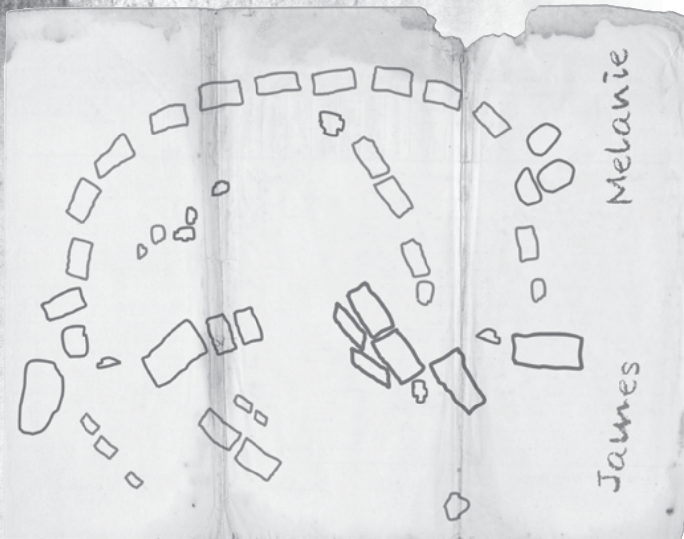
Londres - Document C2