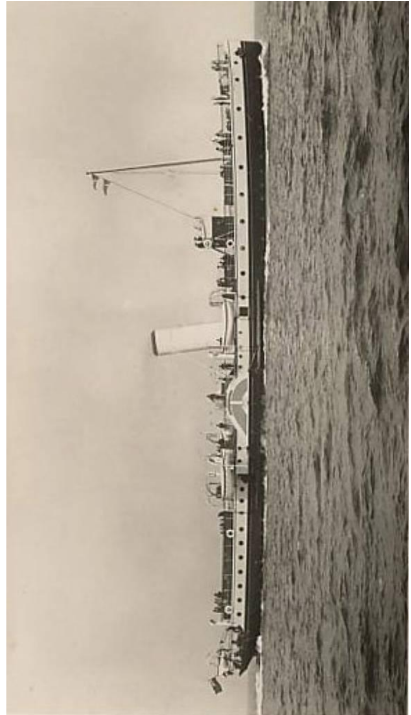
Ferry de Kansk