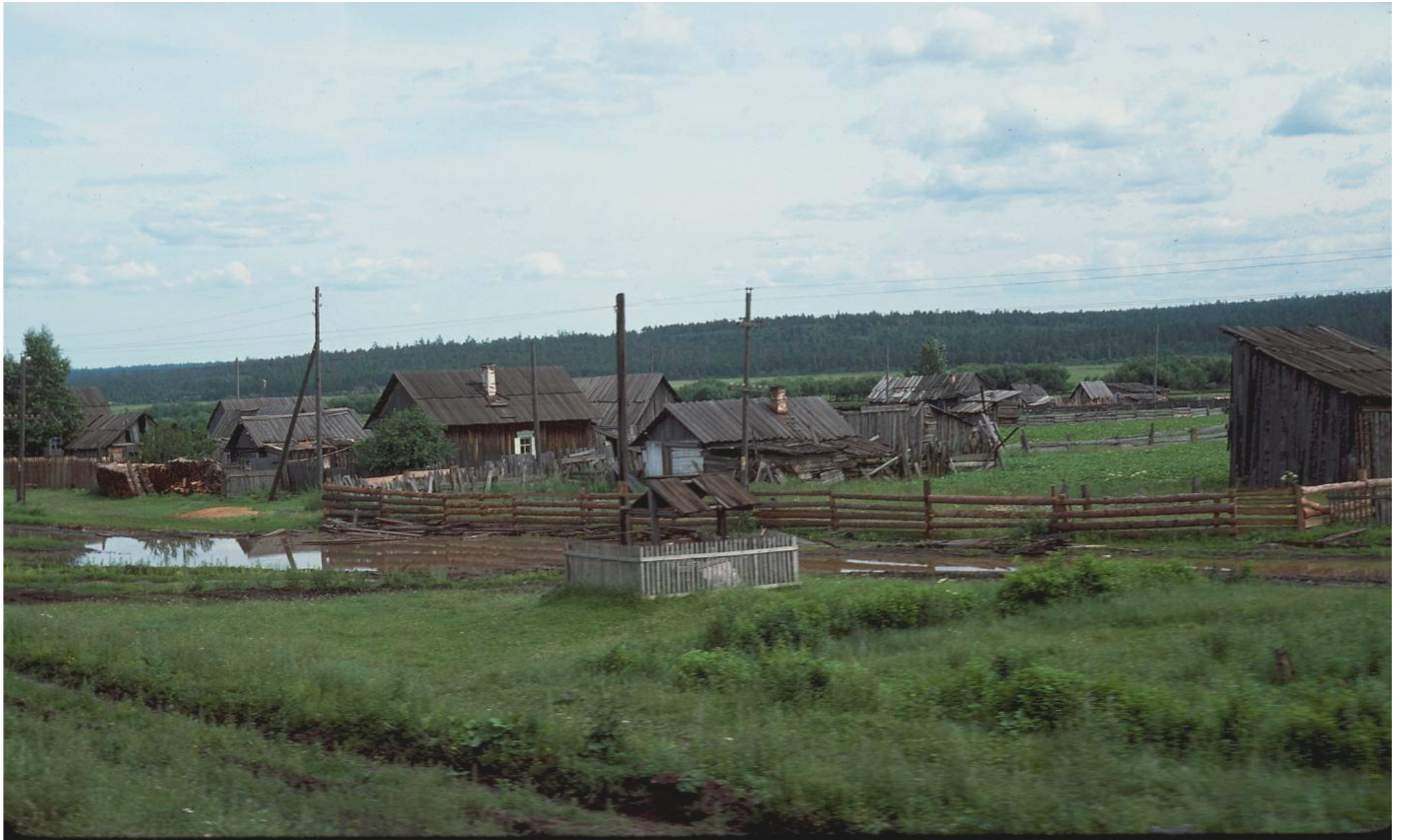
Vanavara en 1919 - Peu après l'arrivée du télégraphe.