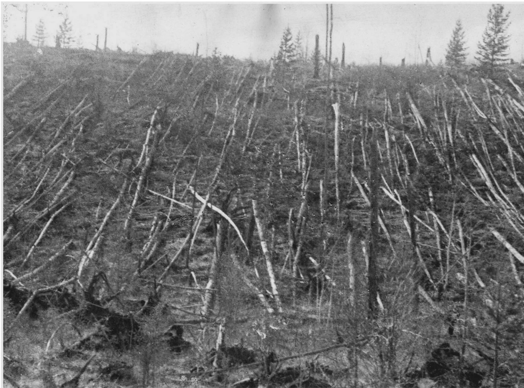
La Plaine après l'explosion