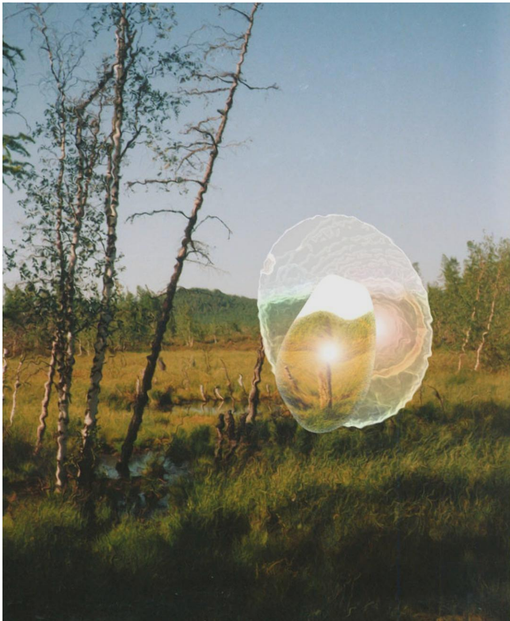
La singularité dans la clairière