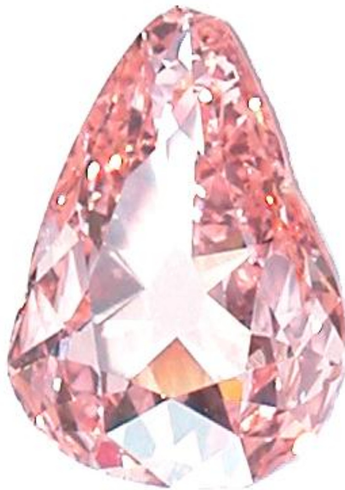
Le Trapézohédron Rutilant