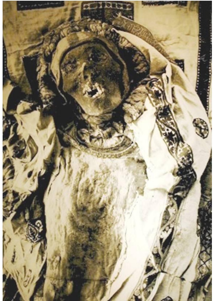
La Momie chrétienne