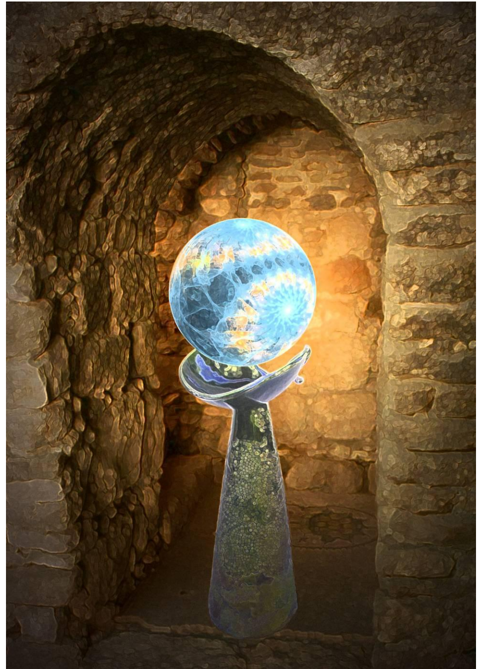
Un orbe dans sa crypte