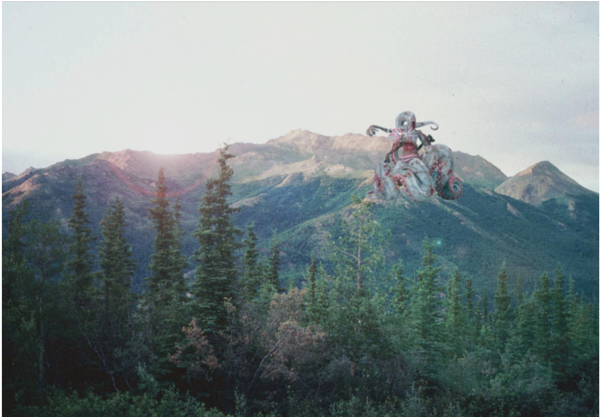
Le hurleur sur la colline