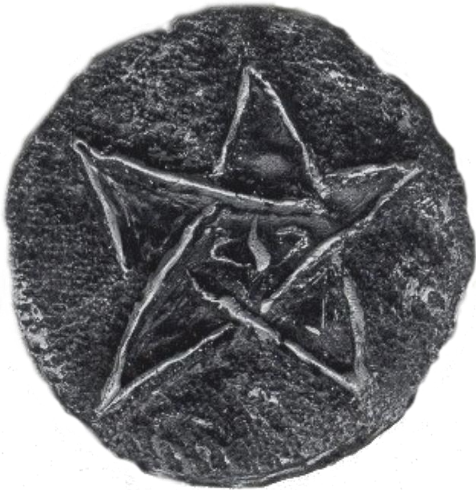
Le Bouclier Antique