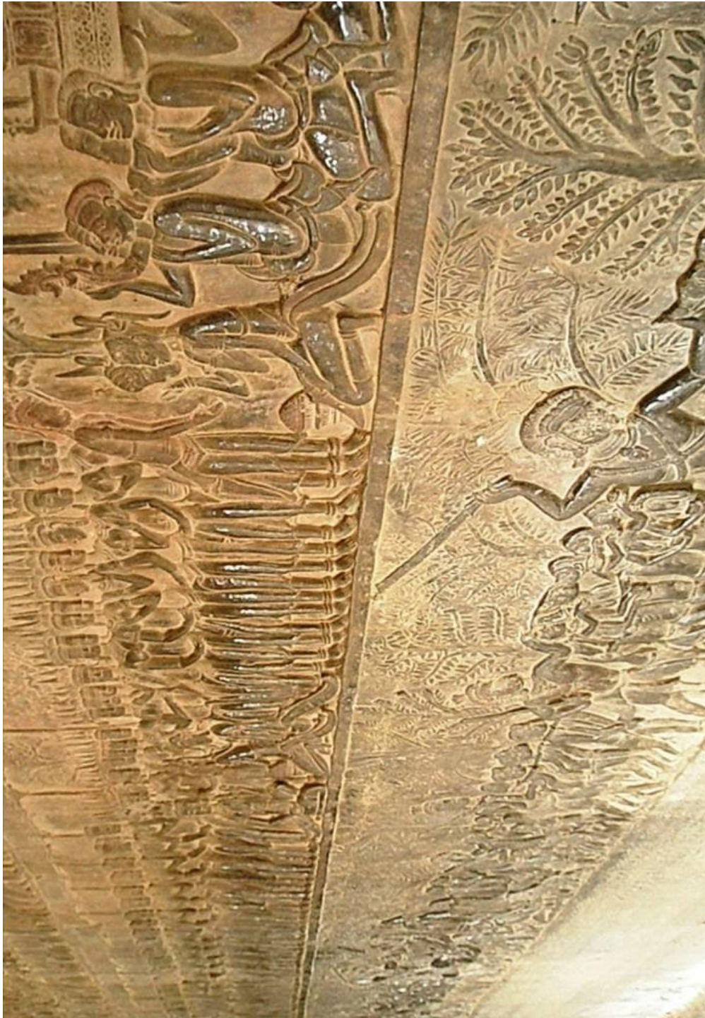
Le bas relief Khmer