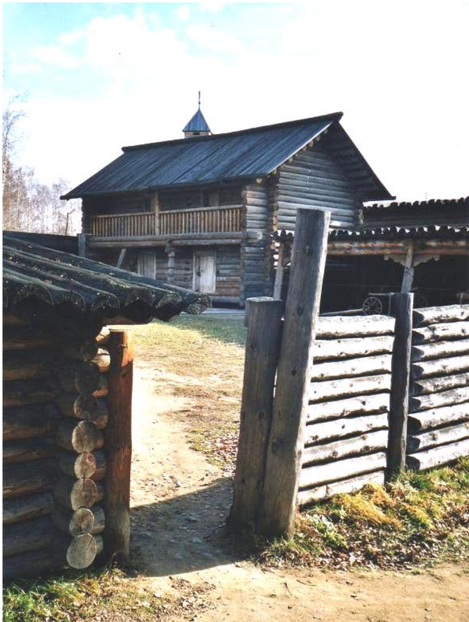
Isba de Svetlana Ivanovna Torpushonok