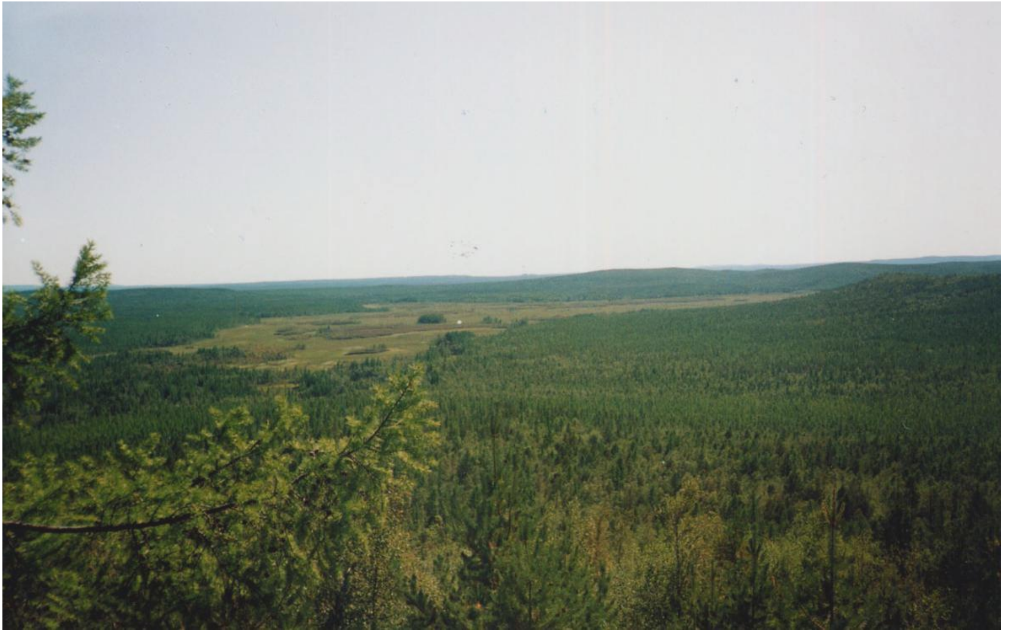
Plaine de la Podkamennaya Tunguska (latitude 60^{\circ}53'09'' Nord, longitude 101^{\circ}53'40'' Est)