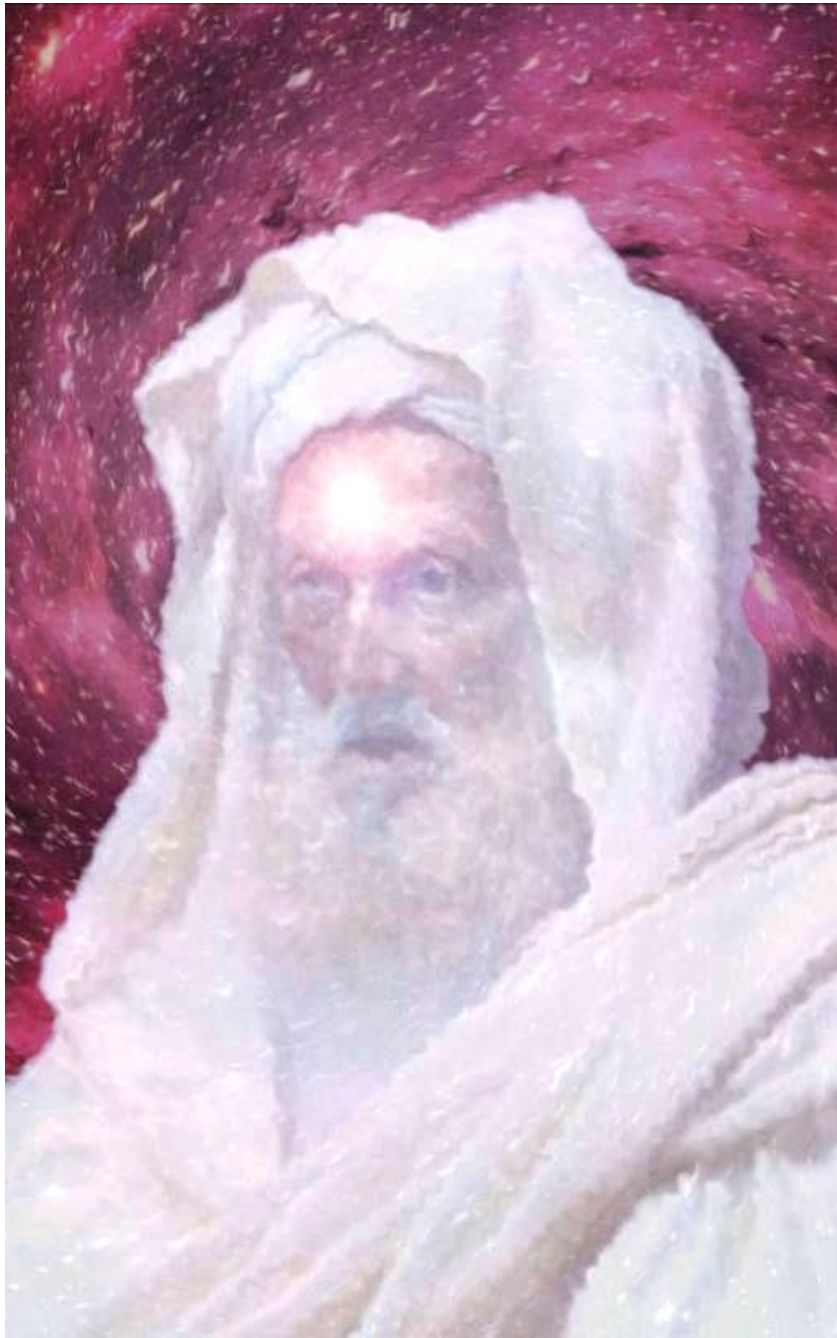
Le vieil homme à la barbe blanche