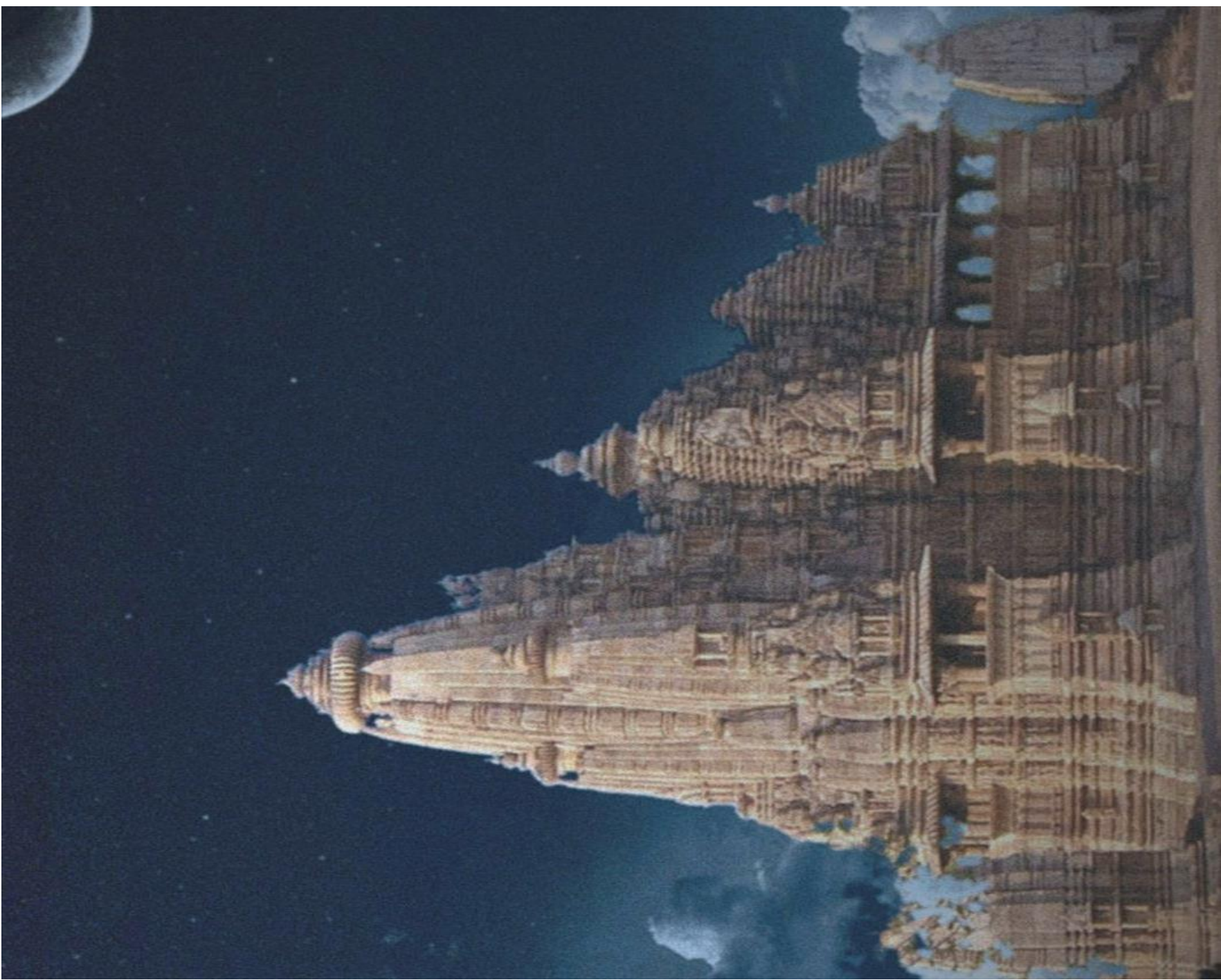
Le Temple étrange