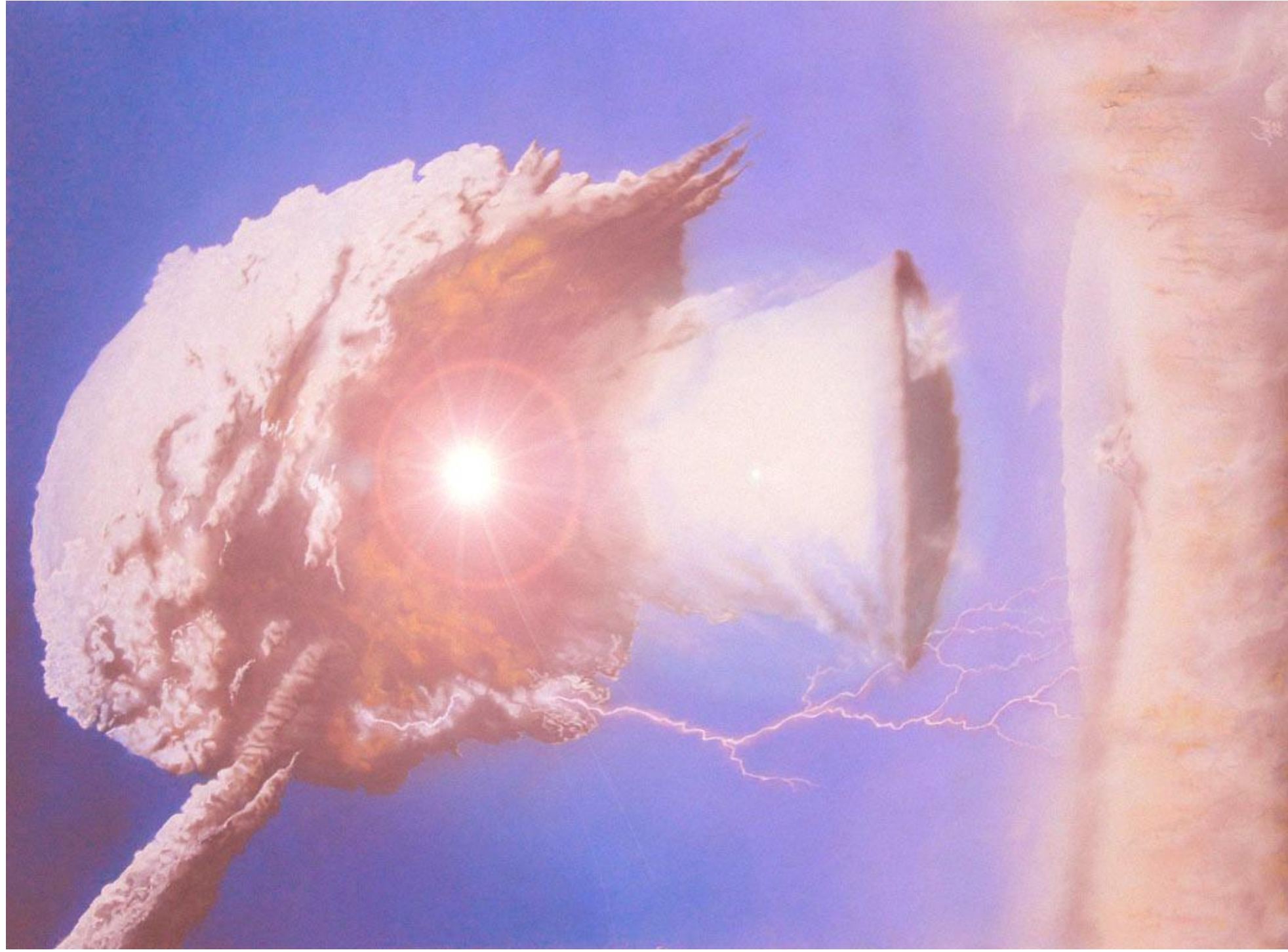
Le chaos nucléaire