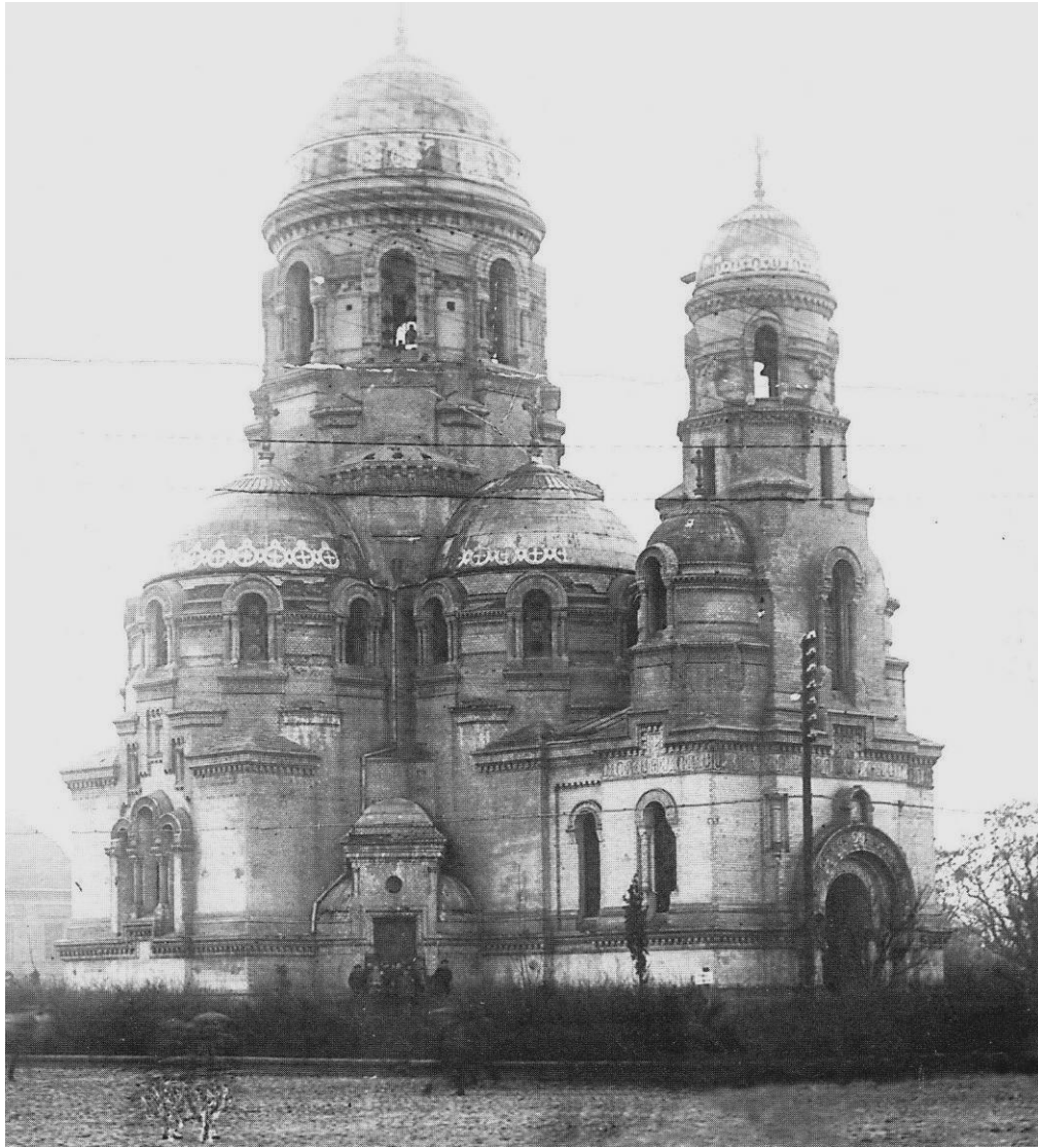
Eglise de Vanavara