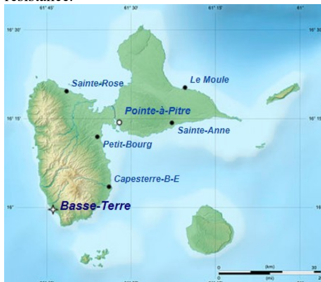
Carte de la Guadeloupe

En 1802, Napoléon révoque l'abolition de l'esclavage, Delgrès et Ignace entrent en résistance.