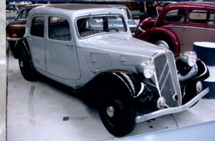
La Citroën 7