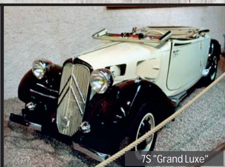
7S "Grand Luxe"