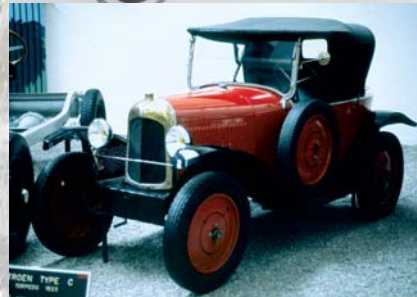
T2 - 2 places