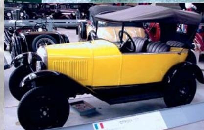
T3 - 3 places