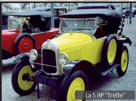
La 5 HP "Trèfle"