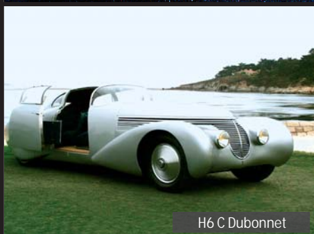
H6 C Dubonnet