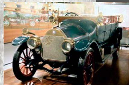
Alfa 24 HP