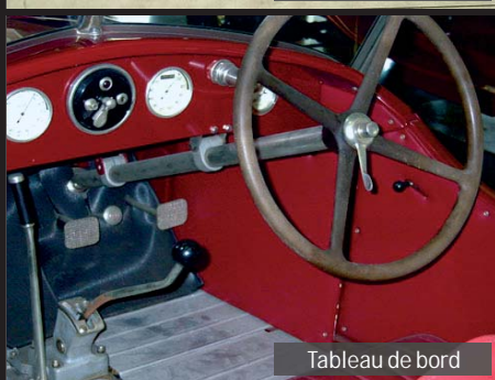
Tableau de bord