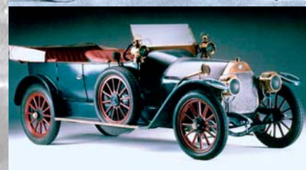
Alfa 24 HP